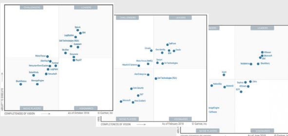
[ Gartner Magic Quadrant 2018 ]

식별 : 리스크와 취약성을 파악하고 사이버 레질리언스 계획 및 로드맵 수립 예방 : 공격자에게 악용되지 않도록 취약점에 대한 보호조치 마련 탐지 : 알려지지 않은 보안 위협까지 탐지, 분석하고 지속적인 모니터링 수행 대응 : 사이버 공격에 효과적으로 대응 및 조치 복구 : 신속한 중요 데이터 및 애플리케이션 복구로 정상 상태로 복구